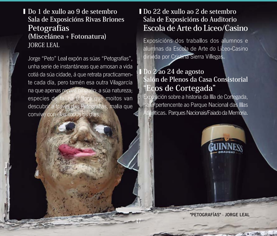
"PETOGRAFÍAS" · JORGE LEAL

Exposición sobre a historia da Illa de Cortegada, hoxe pertencente ao Parque Nacional das Illas Atlánticas. Parques Nacionais/Faiado da Memoria.