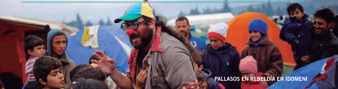
PALLASOS EN REBELDÍA EN IDOMENI