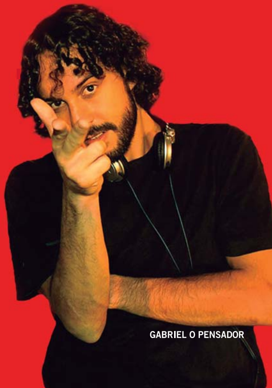
GABRIEL O PENSADOR